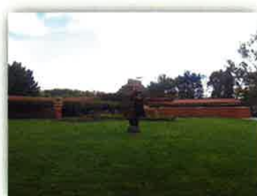
ジョンソンワックス社長 ジョンソン邸 (ミルウォーキー ラシオンエリア)