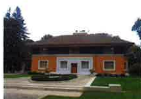
ウインズロー邸 (シカゴ リバーフォレストエリア)