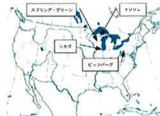
最高傑作(ピッツバーグ) Fallingwater『落水荘』 (世界遺産ノミネート対象)