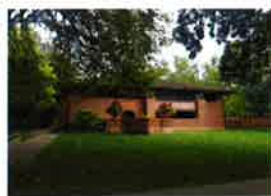
ハートリー邸 (シカゴ オークパークエリア)