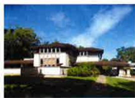
ウイリッツ邸 (シカゴ ハイランドパークエリア)