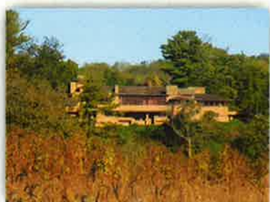
タリアセンイースト(マディソン) (世界遺産ノミネート対象)