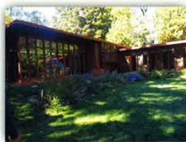
ジェイコブス邸(マディソン) (世界遺産ノミネート対象)