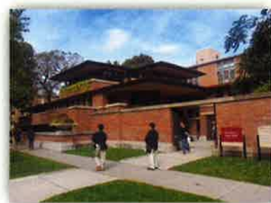
ロビー邸 (シカゴ) (世界遺産ノミネート対象)