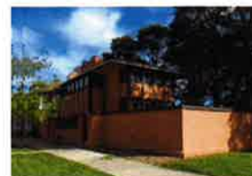
ハーディー邸 (ミルウォーキー ラシオンエリア)