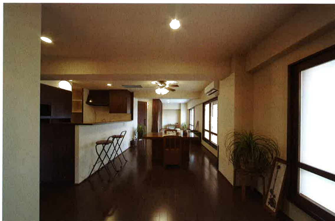
以前は3室に分かれていた部分。玄関から入ってキッチンを中心に、大きな気持ちのいい風通しのいいリビング・ダイニングになりました。

仕事部屋に隣接した防音室。時間を気にせず、演奏や作曲作業ができるようになりました。